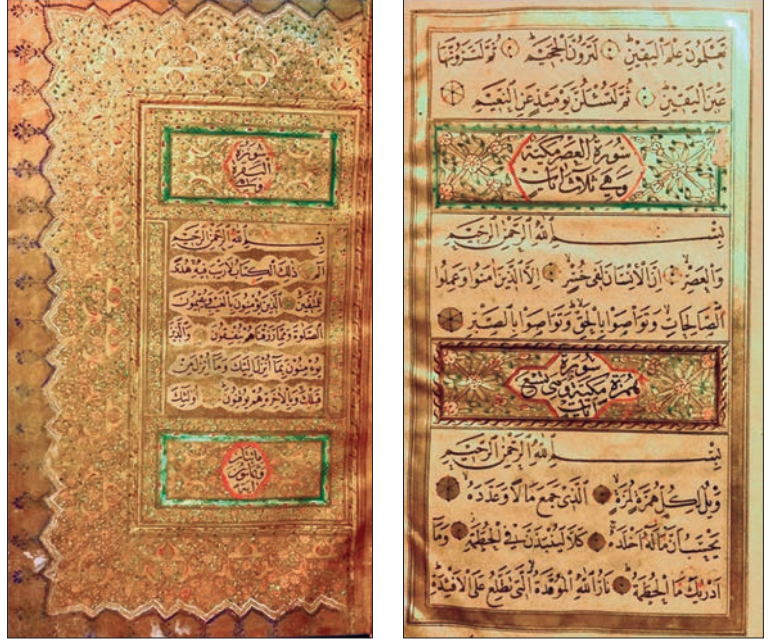
Resim 10. Mushaf-ı Şerif'in Sahaflar Çarşısında satılan, âharlı kâğıda basılmış tezhibli bir nüshasından (Shady EID, Hattat Şekerzade Mehmed Efendi, s. 47,48)

Sanatları Vakfı tarafından büyük bir titizlik ve gelişmiş tekniklerle başarılı bir tıpkıbasımı yapılmıştır (Resim 11).