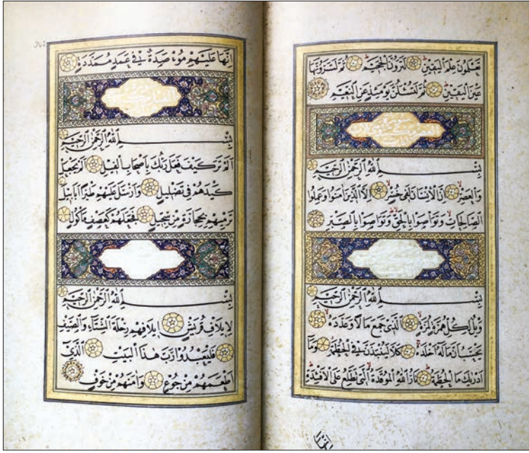
Resim 11. 1146/1733 tarihli Mushaf-ı Şerif'in 2018 yılında Klasik Türk Sanatları Vakfı tarafından yapılan tipkibasımından

Hamdullah ve Hafız Osman'ı takliden yazdığı bu Mushaf'lar, onun bir üstadın yazı üslubunu taklit etme konusundaki olağanüstü başarısını göstermektedir. Bu çalışmalarından başka bazı müze ve koleksiyonlarda kıt'a, murakkaa ve dua mecmuası gibi başka eserleri de bulunan Şekerzâde Mehmed Efendi bilhassa nesih yazıdaki harf bünyelerinde, satır düzeninde ve çizgilerin akışında çok başarılı bir ahenk ortaya koymuştur. Sultan I. Mahmud'un emri üzerine yazdığı 1146/1733 tarihli Mushaf-ı Şerif'in Osmanlı döneminde devlet eliyle ve ilk kez basılması da şüphesiz onun nesih yazıdaki ve Kur'ân-ı Kerîm kitabetindeki başarısının bir sonucudur.