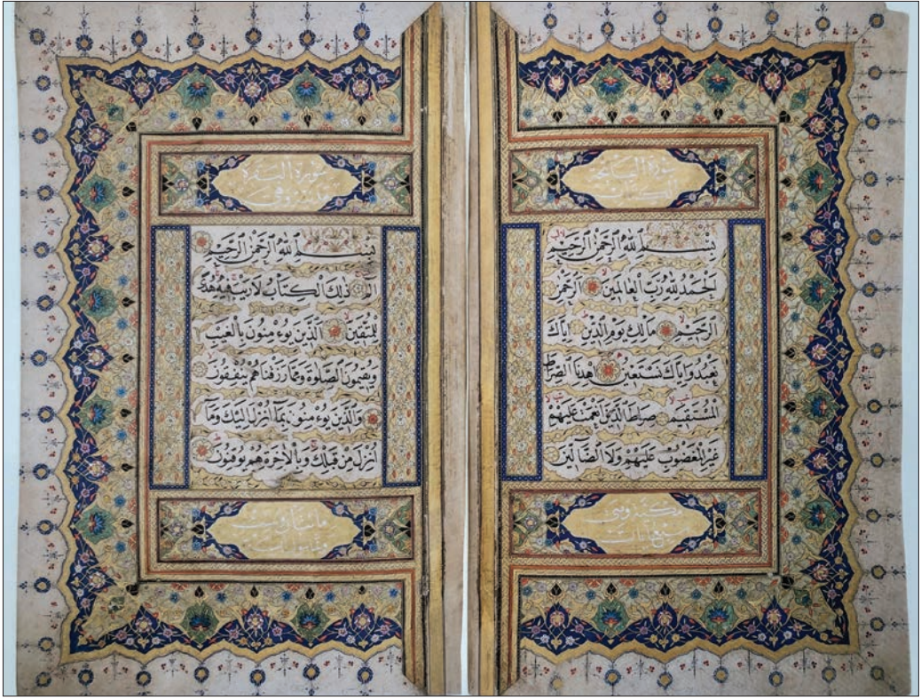
Resim 3. Şekerzâde Mehmed Efendi'nin Türk ve İslam Eserleri Müzesinde Bulunan (TİEM,85) Mushaf-ı Şerifi (1400. Yılında Kur'an-ı Kerim, İstanbul 2010, s. 432,433)

Mushaf-ı Şerîf daha yazmasını emretmiştir. Bunun üzerine Medine'ye gidip bir yıl orada kalan hattat Mehmed Efendi istenen Mushaf'ı yazdıktan sonra İstanbul'a dönmüş, ancak bu sırada Padişah, Patrona Halil ayaklanması ile tahttan indirildiği için, tezhib ve cildini de yaptırıp Mushaf'ı tahtın yeni sahibi Sultan I. Mahmud'a arz etmiştir. Sultan Mahmud, kendisine hürmet ve takdirlerini belirterek çok beğendiği eseri kütüphanesine koymuştur (Resim 4). 10